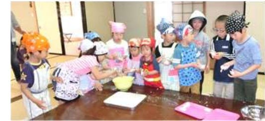
みんなで楽しくコネコネ、まるまる…