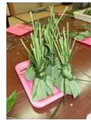
GOOD! 素晴らしい出来です！