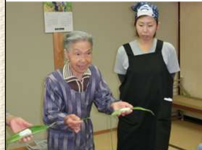
笹の新芽の香りを大切に、団子を中央に置いて3枚の笹で包みましょう。…お母さんも興味津々、一生懸命聞いていました。