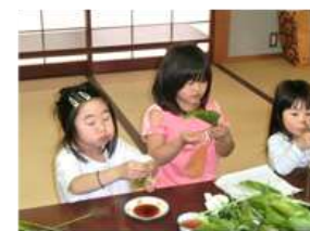
最後にみんなでおいしく頂きました。途中新聞紙で兜も作りました。子供たちの健やかな成長を願ってのイベントでした。

次は5月15日(日)にさつまいものほか、トマト、トウモロコシなどの野菜の植付けを行います。区民の皆様も是非子供農園までおいでください。