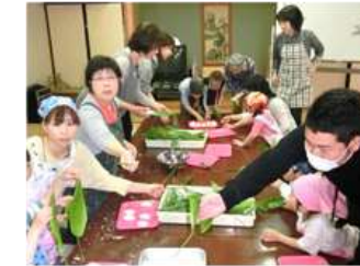
作り始めると、こども達より、お母さんお父さんの方が夢中！最後どうやって結ぶの……？