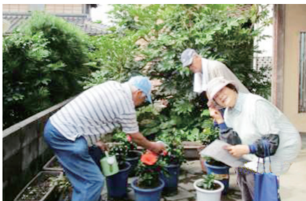
生育状況の点検とふれあい訪問

配布後は、管理アドバイザー（会員の中から選定）2名と役員が、年に2回会員宅を訪問し、水やりや、葉の生育状況、虫のつき具合等を点検指導に訪問して、見守り活動につなげています。これ以外にも、元気のない鉢植えを見かけたら、立ち寄って声をかけたり相談に乗っています。花を通じて自然に会話も生まれ仲間づくりにもつながっています。昨年10月には、鳥取県みどりの伝道師を招いて、「ハイビスカスの上手な育て方について」研修会を実施、16人が参加しました。土の改良、葉の害虫対応、枝の剪定時期や方法について指導していただきました。