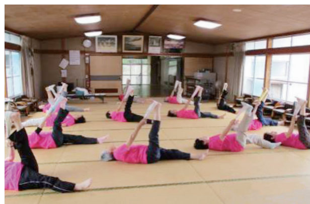
「ゆりりんサロン」でタオルを使った運動