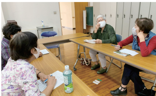
グループで情報交換

内容は基本的な文字の入力、検索の仕方、便利なアプリケーションの使い方などについて。カレッジを通じて人と人とのつながりが生まれるように、グループ（6名）に分け、気軽に教えたり習ったりできるように、文字入力の練習に「しりとり遊び」や「連想ゲーム」を取り入れています。