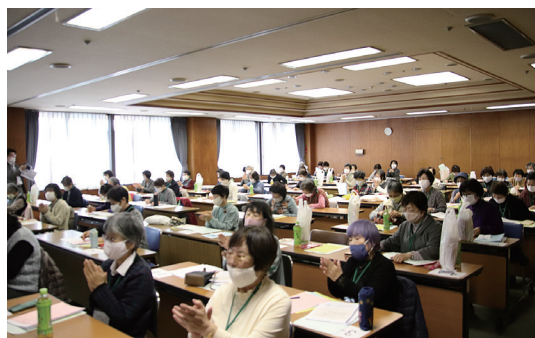
マスクの下はみんな笑顔（名古屋）

終了後のアンケートには、「コロナで八方ふさがりのなか、何かできることのヒントをいただいた気がします」など、今後の活動に向けた前向きな回答が多くありました。