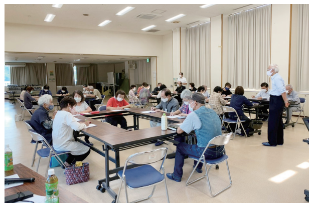
人気のスマートカレッジ