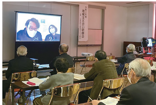
オンラインの画面に見入る参加者（鳥取）

また、中止した「地域活動リーダー育成研修会」は、4名のリーダーに集まってもらい、予定していた活動発表の様子をDVDに収録して配布しました。